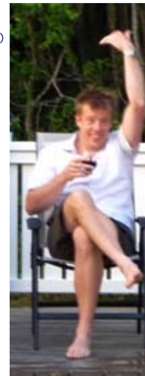
Ingen lycka för Totte i Super Six

Tävlingen har upphört pga. att alliansen lagt ned sin verksamhet.