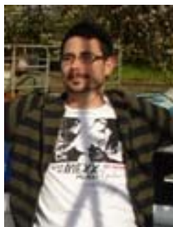
Danne trea i Riddarslaget