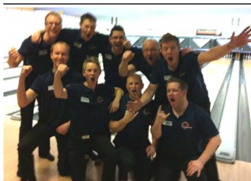
Laget som tog vår enda bortaseger i allsvenskan, mot Bjuv 10-9