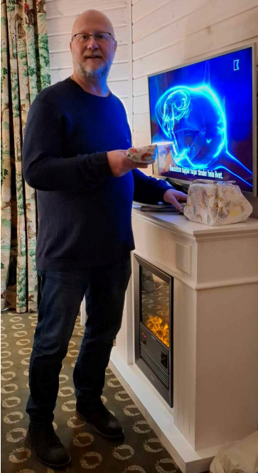
Dojjan prisutdelare ovan och pristagare nedan

Efter lördagens restaurangbesök så blev det prisutdelning på hotellet där det delades ut ett förstapris och elva andrapris. Ja, alla som inte vann fick komma tvåa. Gula tröjor blev det och eftersom det var andra gången vi gjorde redan så blev det 2 för resan och sen placering på tröjorna.