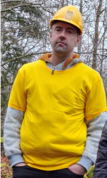
Zorrowscupsegraren Kim i seger och gruvmundering.

Hösten 2023 ordnades en ZorrowsCupresa till Västergötland med gott resultat vilket gjorde att beslut togs att pröva samma koncept även hösten 2024.