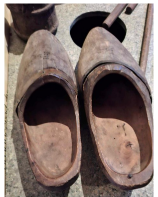
Bowlingskor från förr?