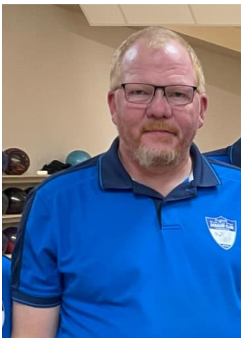
Robban 718 i Mjölby